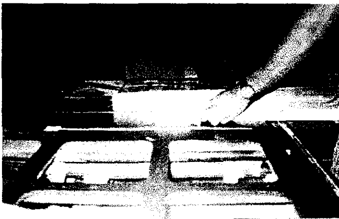
Risco de projeção de madeira pelo contato com ferramentas de corte em alto giro.