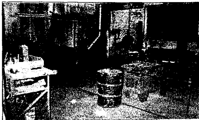
Vista geral do setor de marcenaria.

Prédio de alvenaria com área de aproximadamente 50m 2 , piso de concreto, cobertura de fibrocimento, ventilação natural e, sistema de iluminação artificial (lâmpadas fluorescentes) e natural.